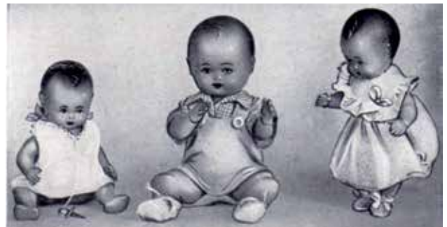
5 - Bambole in camiciola.