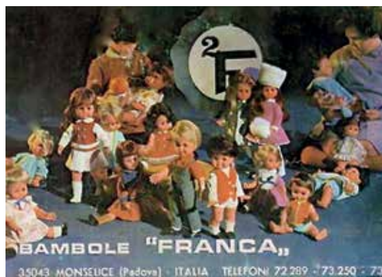
1 - Carrellata di bambole "Franca" anni '60.

Nel 1968 la produzione si diversificò per un mercato più esigente producendo bambole e bebè abbigliati in modo più ricercato e destinati ai grandi magazzini di tutto il mondo. La ditta intuisce da subito che prima o poi il mercato italiano si sarebbe saturato e così indirizza la sua produzione verso sbocchi internazionali. Una bambola, uscita dalla fabbrica proprio in questo anno è Martina (foto 2 e 3) di "nuova generazione", come recita lo slogan, perché cammina grazie al suo funzionamento a batteria. Si presenta in diverse versioni, perché ha diversi colori d'abito.