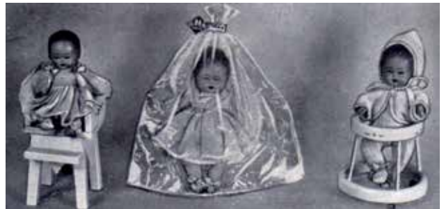
4 - Bamboline Oltolini in varie confezioni.